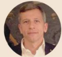
ENRICO COSCIONI Presidente dell'Agenzia nazionale per i servizi sanitari regionali