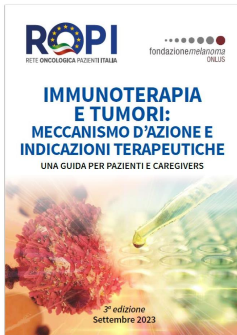
Immunoterapia e tumori: meccanismo d'azione e indicazioni terapeutiche