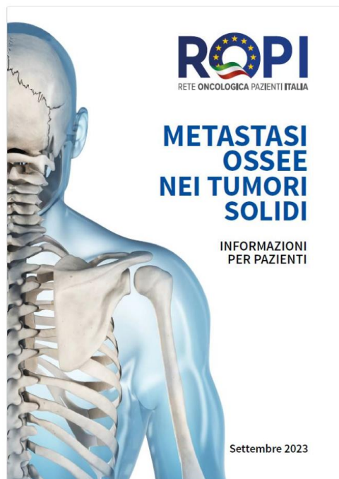
Metastasi ossee nei tumori solidi

Adenocarcinoma del pancreas | Carcinoma mammario | Carcinoma dello stomaco | COVID-19 | Caregiver